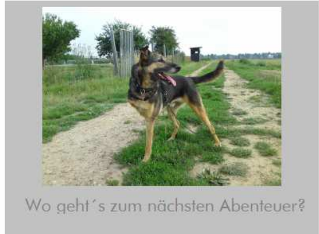
Wo geht's zum nächsten Abenteuer?