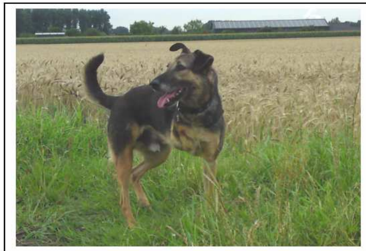
PLUTO Eine ganz besondere Erfolgsgeschichte!