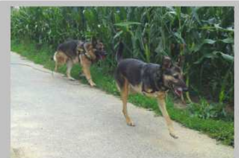
Konditionell steht Pluto kaum noch nach