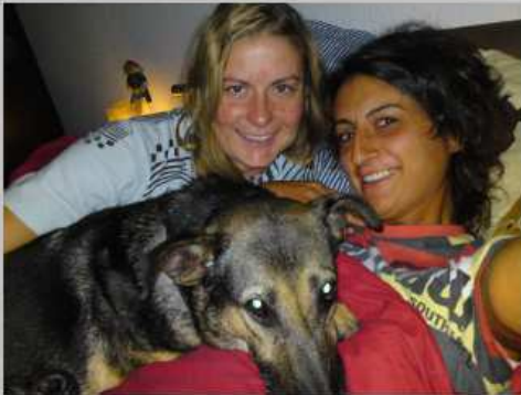
Ein Hund im Bett? Nee, ZWEI!!!