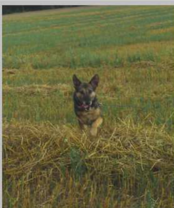
Nicht mehr zu bremsen!