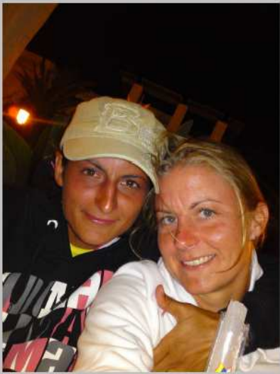
Meine Frau und ich

Zuhause in der Wohnung ist Jordan mehr Schaft als Schäferhund, aber an der Leine ein Ego, so groß, dass man damit schwerlich durch irgendeinen Türrahmen passt! Und doch ist uns immer wieder aufgefallen, dass ihm andere „Reviereindringlinge“ ziemlich gleichgültig sind, solange er in Hundegesellschaft unterwegs ist. Da er außerdem jeden Tag ein paar Stunden alleine ist, haben wir uns dann doch dazu entschlossen für ihn ein „Geschwisterchen“ zu adoptieren.